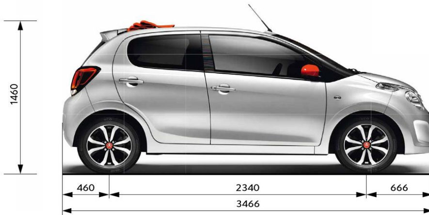
Maße in mm